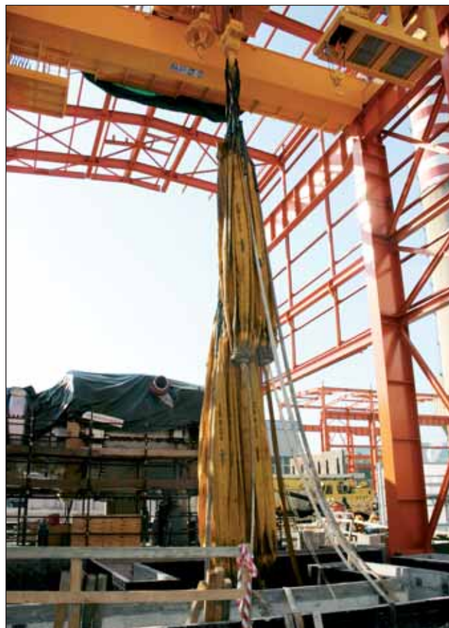
La particolare logistica del sito e la necessità di limitare al massimo le interferenze sia con le operazioni in corso di svolgimento sia con la normale operatività della centrale hanno spinto la committenza a rivolgersi ad ATS per il collaudo dell'attrezzatura