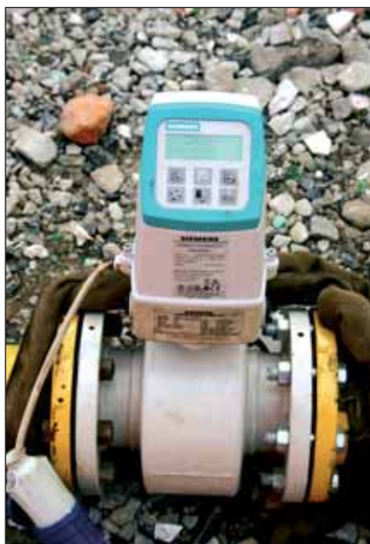
Il sistema impiega appositi flussometri contaltri che consentono di determinare l'effettivo carico applicato convertendo i litri in chilogrammi

Le particolarità logistiche che caratterizzano il sito d'installazione della struttura di sollevamento hanno permesso di apprezzare in pieno i vantaggi del sistema di collaudo A.T.S.: in primo luogo, il raggiungimento dei valori massimi di