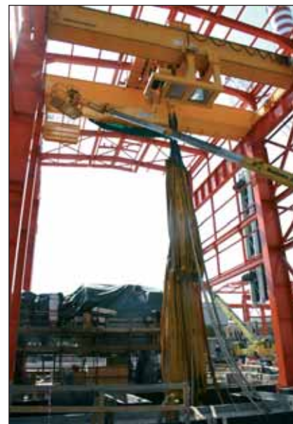
In ogni punto di sospensione possono essere applicati un massimo di tre palloni alla volta. Nel caso di test oltre le 100 t viene utilizzato un bilancino supplementare o funi speciali che consentono un'applicazione complessiva per triadi combinate di palloni