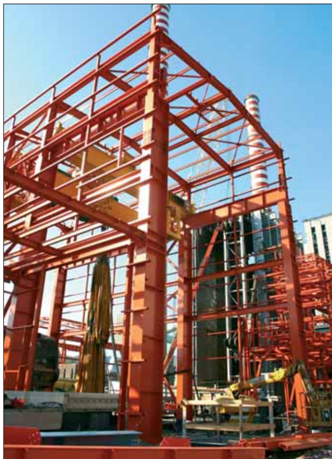
I lavori di riqualificazione della centrale termoelettrica di Vado Ligure hanno comportato l'installazione di un carroponete equipaggiato con tre argani di sollevamento della portata nominale di 130 t, 25 t e 12,5 t

Originariamente concepita per il collaudo dei sistemi di sollevamento "off-shore" sulle piattaforme petrolifere, questa metodologia garantisce una maggiore sicurezza rispetto all'uso dei pesi solidi tradi-