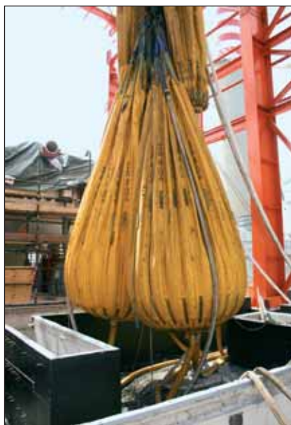
Una volta riempiti d'acqua, i palloni più capienti, quelli da 35 t, raggiungono il diametro di 4,2 m e un'altezza di 7 m

Il ciclo di prove di carico stabilito per il collaudo del carroponete ha