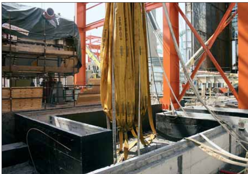
I palloni Water Weights utilizzati da ATS sono realizzati con un doppio strato di PVC armato internamente con una rete di poliestere

Il loro ingombro è esiguo: vuoti, hanno un peso che varia da 95 a