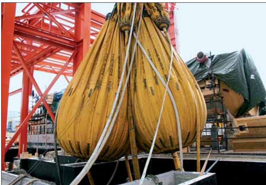
La velocità di riempimento dei palloni è in funzione della portata garantita dall'impianto idraulico cui questi sono collegati: in questo caso sono risultate necessarie circa tre ore per il raggiungimento del carico massimo previsto (165 t)

A questi vantaggi di natura logistica e organizzativa si sommano quelli relativi alla sicurezza e alla precisione della procedura di collaudo, nonché all'estrema flessibilità dei test eseguibili. Se realizzata con carichi fissi tradizionali, ad esempio blocchi di calcestruzzo o metallo, la prova di carico potrebbe, in caso di problemi alla struttura o agli impianti, avere esiti distruttivi a causa dell'applicazione totale e immediata - obbligatoria con gli strumenti citati - del carico previsto. L'applicazione graduale del carico, consentita dal riempimento progressivo con