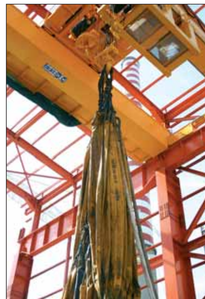
Il ciclo di prove di carico è articolato in una prima fase, con raggiungimento dei valori di portata nominale massima e successiva verifica delle tarature dei sistemi di controllo e dei limitatori di carico, e una seconda, con raggiungimento dei valori di sovraccarico stabiliti e controllo del comportamento flessionale delle strutture di sostegno in acciaio

carico previsti per i test (circa 165 t) avrebbe comportato, in caso di adozione di metodologie tradizionali, la necessità di trasportare e stoccare un numero elevato di blocchi di calcestruzzo, operazione resa impossibile dall'esigenza di non pregiudicare né l'operatività del cantiere, né le normali operazioni di